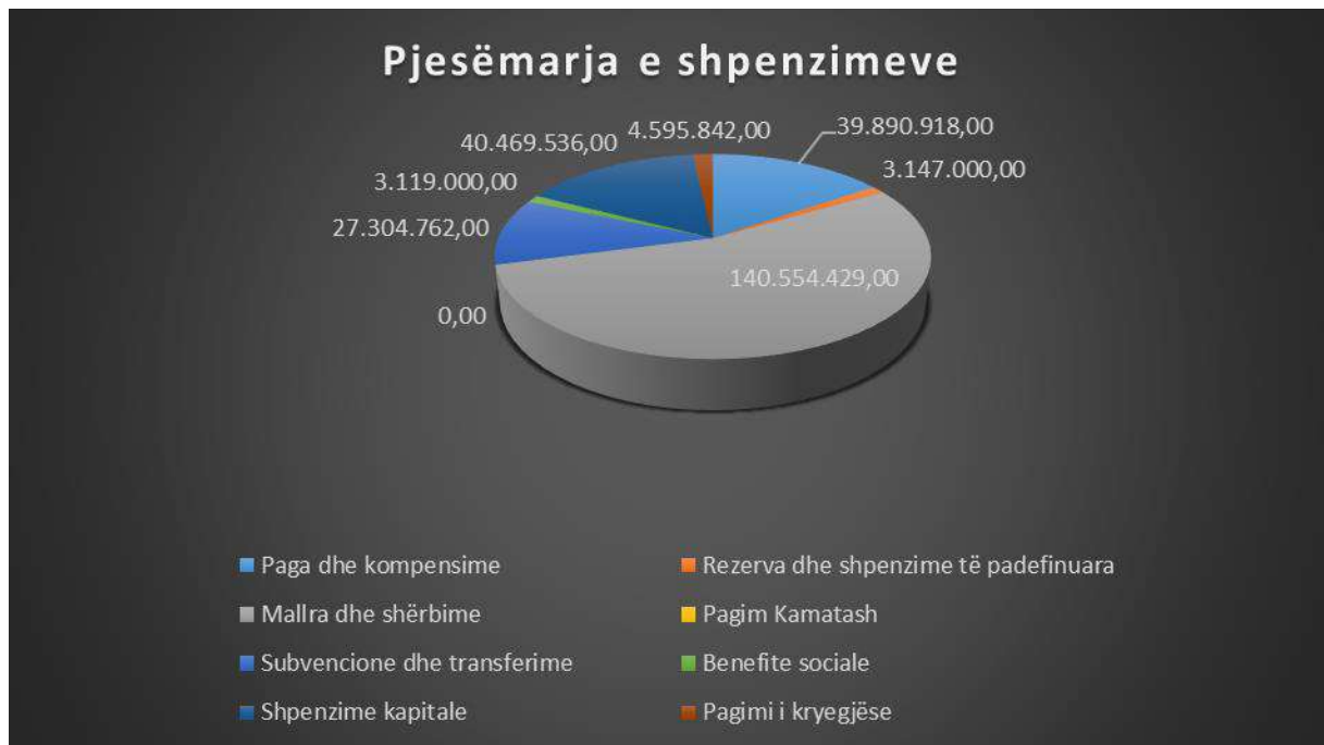
Grafikoni nr.2: Pjesëmarrja e shpenzimeve sipas llogarive në shpenzimet e përgjithshme të Komunës së Çairit