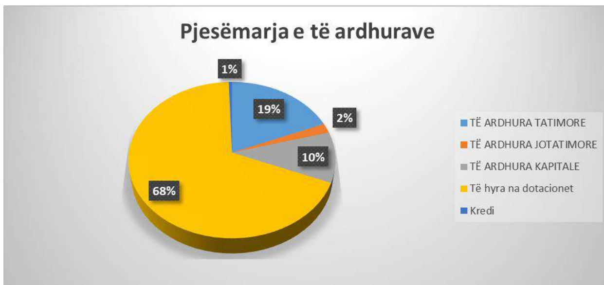
Grafikoni 1 : Pjesëmarrja e të ardhurave sipas llogarive në të ardhurat e përgjithshme të buxhetit të Komunës së Çairit