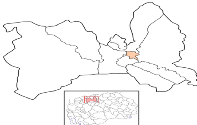
Слика 1 Местоположба на општина Чаир

На слика 1 е прикажана местоположбата на општина Чаир во рамките на Градот Скопје.